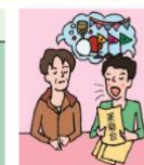
日本語が第一言語でない家族や障がいのある家族のために通訳をしている