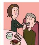
障がいや病気のある家族の身の回りの世話をしている