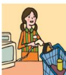
家計を支えるために労働をして、障がいや病気のある家族を助けている