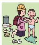
家族に代わり、幼い子どもたちの世話をしている