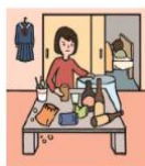
アルコール・薬物・ギャンブル問題を抱える家族に対応している