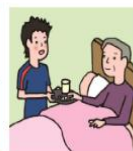
がん・難病・精神疾患など慢性的な病気の家族の看病をしている