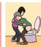
障がいや病気のある家族の入浴やトイレの介助をしている

「ヤングケアラー」は、法令上の定義はありませんが、一般に、本来大人が担うと想定されている家事や家族の世話などを日常的に行っている子どもとされています。