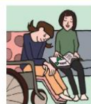
障がいや病気のあるきょうだいの世話や見守りをしている