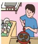
障がいや病気のある家族に代わり、買い物・料理・掃除・洗濯などの家事をしている

家族にケアを要する人がいる場合に、大人が担うようなケア責任を引き受け、家事や家族の世話、介護、感情面のサポートなどを行っている18歳未満の子どものことをいいます。