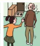
目を離せない家族の留守りや声かけなどの気づかいをしている